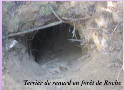
Terrier de renard en forêt de Roche

De l'étude des différentes pièces du dossier, il apparaît que les bois de Roche avaient été délimités en 1739 avec des bornes apparentes, mais qu'une partie de ces dernières avait été soit enterrée soit déplacée ; nécessairement par celui à qui cela profite... Cela nécessite qu'une commission d'experts et un géomètre soient diligentés pour rétablir la délimitation des cantons de bois selon le plan de 1739. D'assignation en contestation, de condamnation en appel, le préfet impose en 1846 la délimitation des bois. Le Conseil Municipal de Roche estimant que les bornes de cette délimitation, quoique très anciennes, existent sur le terrain, proteste contre les frais ainsi occasionnés.. Le litige aura duré 56 ans et concerné plusieurs générations !