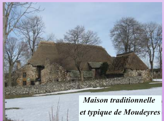
Maison traditionnelle et typique de Moudeyres

Suite de la vente des documentaires adultes à prix très intéressant.