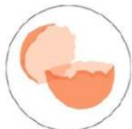
Coquilles d'œufs écrasées