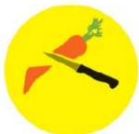
Pensez à découper