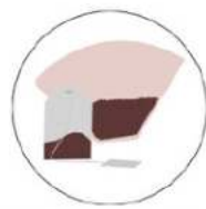
Café et thé avec filtres