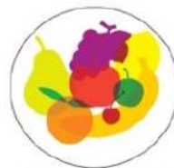
Déchets de fruits crus ou cuits