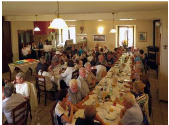
le repas franco-italien 2022