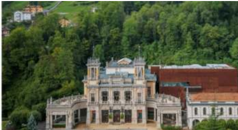
Thermes de San Pellegrino