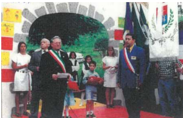
1997 signature du serment