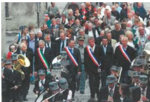
2012 à Santa Brigida (15 ans)