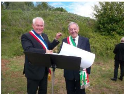
2017 à Roche lez Beupré (20 ans)