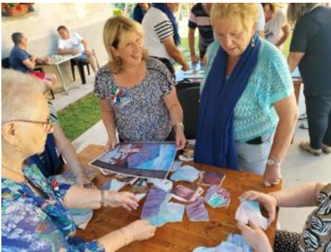
ensemble après l'Assemblée Générale