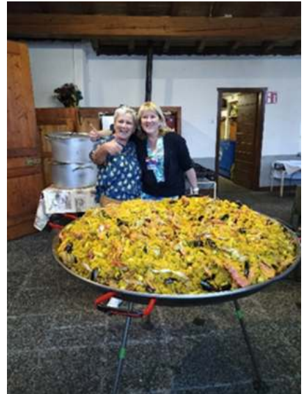
la paëlla géante