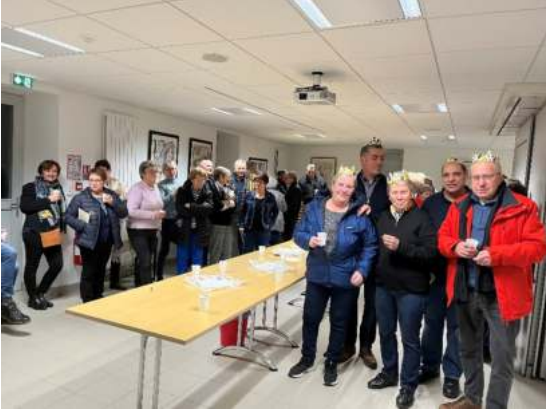
la galette des Rois

A Roche lez Beauré, le comité de jumelage offre aussi de nombreuses occasions de rencontres, de partage, de jeux, de repas en commun dans une ambiance amicale.