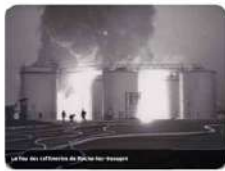
Le feu des raffineries du Midi à Roche-les-Beaupré

Le 29 décembre 1973, à 2 h 10, le centre de secours principal de Beaupré reçoit à 20h30 un appel de secours. Une cuve de 1430 m3 de super-carburant est en feu. Les pompiers de toute la région parviendront à le maîtriser sans autre dégât de déflagration.