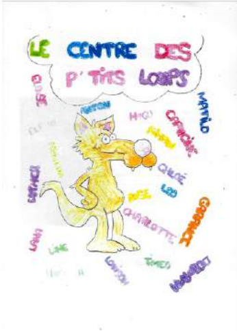
L'équipe des rédacteurs