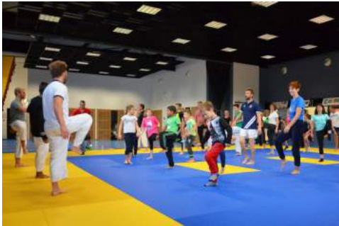
Rencontre Taïso le 6 octobre dernier

De nombreux événements ont marqué la vie associative de l'AJBE au cours des deux derniers mois.