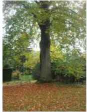
Hêtre, rue de la Gare