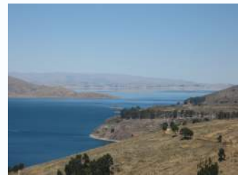
Le Lac Titicaca, depuis la Bolivie