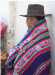
Indienne à Yamparaéz (Bolivie)