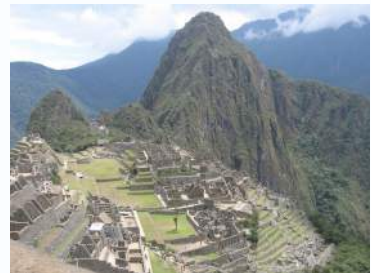
Vue sur le Machu Picchu (Pérou)

Retrouvez les résumés et les galeries de photos de nos animations sur notre blog bibliothequeroche.overblog.com