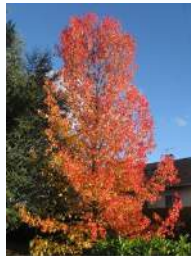
Liquidambar, rue du Ruisselet