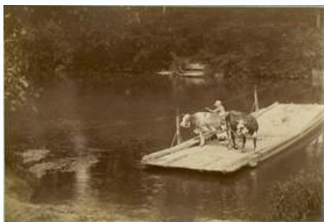
Bac sur le Doubs