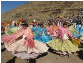
Fête au village Chacachaca (Pérou)