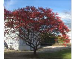
Sumac de Virginie, rue des Hôtes