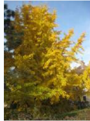
Ginkgo biloba, chemin du Halage