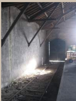
Deux vues de l'intérieur de la gare de marchandises

La cour SNCF et l'emplacement de la gare de marchandises devenu libres seront vraisemblablement aliénés à court ou moyen termes.