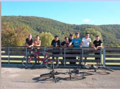
Heureusement, une grande partie de la jeunesse profite des installations sportives ou autres sans les dégrader

Si chacun y met de la bonne volonté, la vie de tous s'en trouvera améliorée.