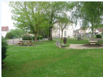
... le square aujourd'hui

Depuis 2006, la cour de la gare marchandises est close.