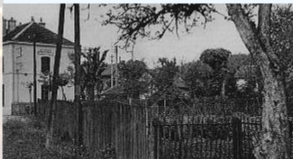
Le jardin hier ...

Le 4 février 1920, le compagnie PLM cède à la Commune l'avenue de la Gare, depuis la statue de la Vierge, alors placée à l'entrée de l'actuel passage inférieur, jusqu'à la cour des voyageurs.