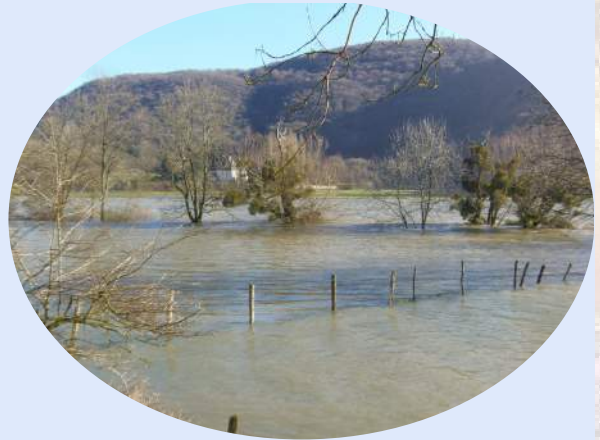
Les "prés" entre Doubs et canal