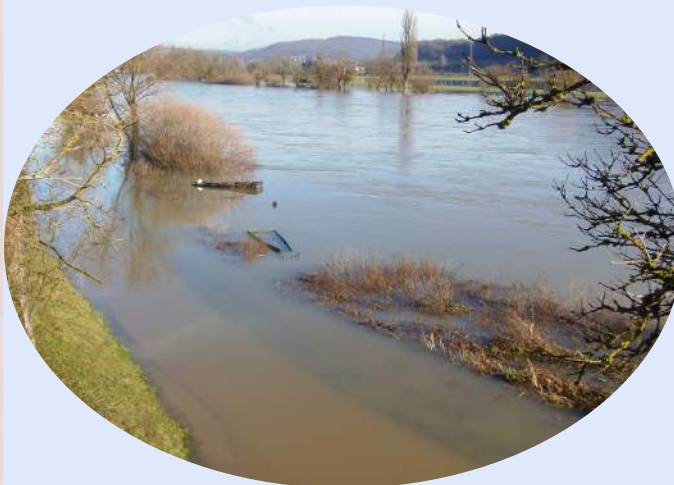
Près du grand terrain de foot