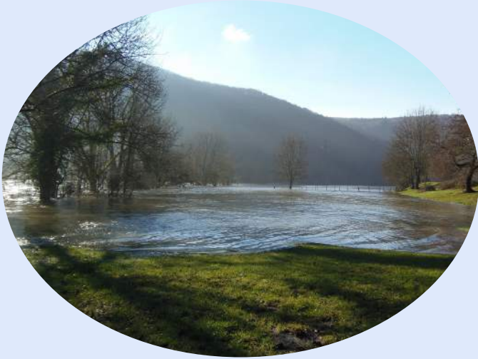
Le "Creux chaud"