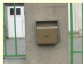
Ecole Jules Ferry