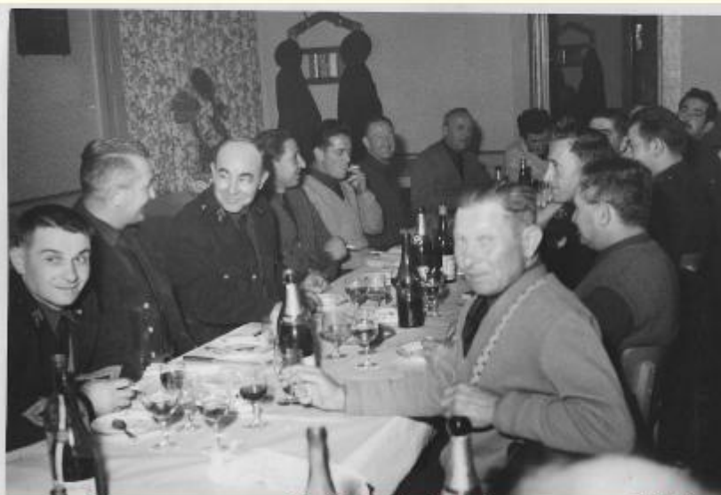
Banquet au « Café de la Marine » vers 1950