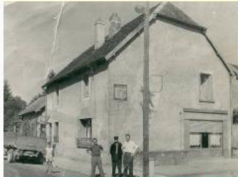
Le commerce en 1942