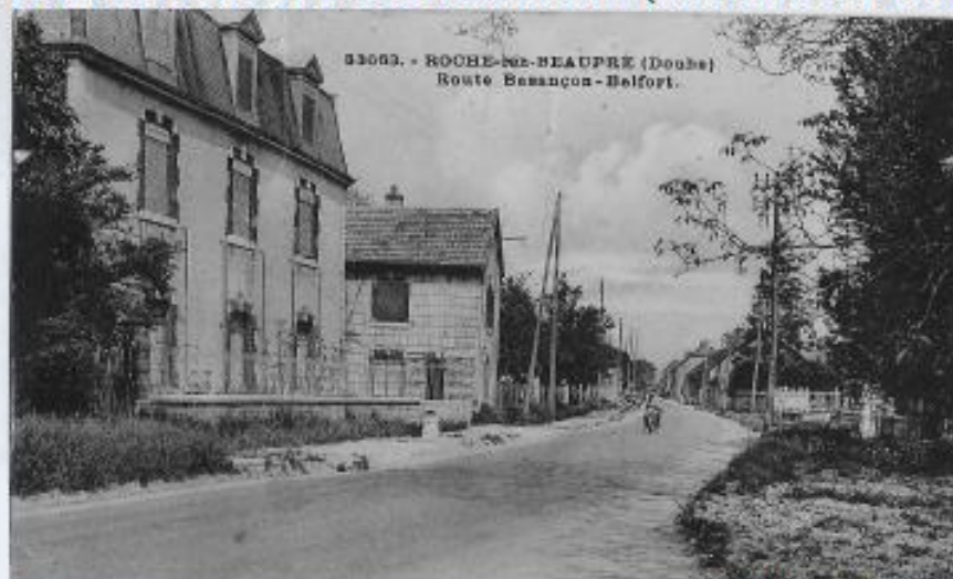
La Route Nationale