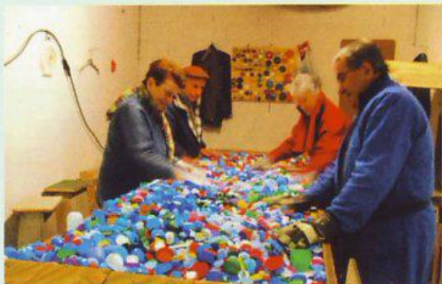
Une partie des bénévoles triant les bouchons...

Doubs et du Jura. Nous vous rappelons de ne mettre que des bouchons de boisson. Nous trouvons souvent des capsules en fer, piles, vis, clefs, pinces à linge, etc... Placer votre sac noué dans le conteneur, surtout ne pas les mettre en vrac dans celui-ci. MERCI